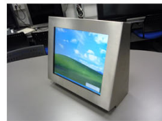
BILDSCHIRM EINES MEDIENELEMENTES AUS EDELSTAHL