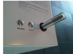
MEDIENELEMENT MIT ELEGANTEM HÖRSTAB