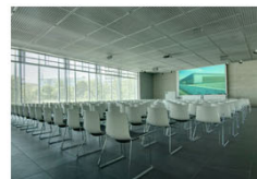
BLICK IN DAS AUDITORIUM DER TOPOGRAPHIE DES TERRORS