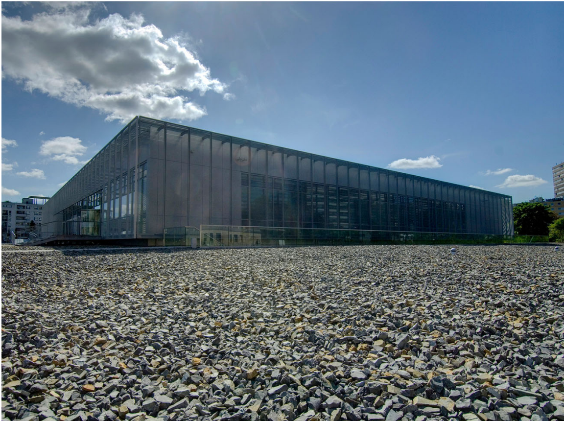
BLICK AUF DAS AUSSTELLUNGSGEBÄUDE DER TOPOGRAPHIE DES TERRORS