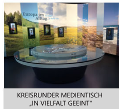
KREISRUNDER MEDIENTISCH „IN VIELFALT GEEINT“