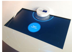
HAPTISCHES OBJEKT ZUR INTER- AKTION MIT DEM TISCH