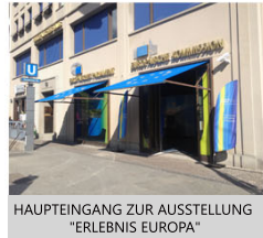
HAUPTINGANG ZUR AUSSTELLUNG "ERLEBNIS EUROPA"