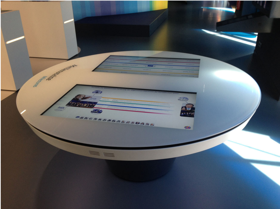
MEDIENTISCH „MEILENSTEINE“ MIT 42“-BERÜHRUNGSBILDSCHIRM